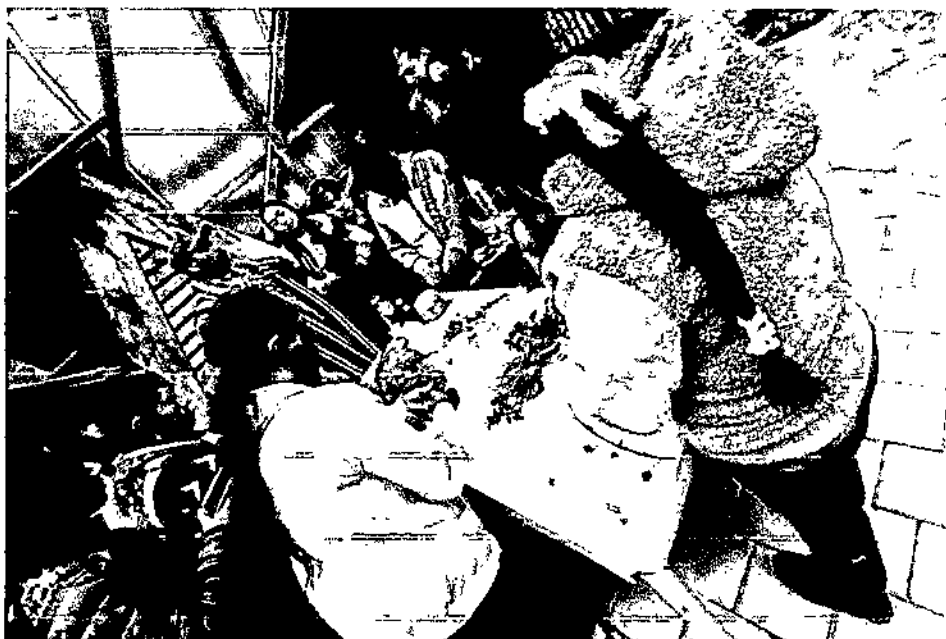
Tabla 2. Actividades de medicina tradicional, Municipio de Colon, vigencia 2025

Las actividades desarrolladas generaron beneficios directos para la comunidad atendida y contribuyeron al cumplimiento de los fines sociales para los cuales fue creada la Asociación.